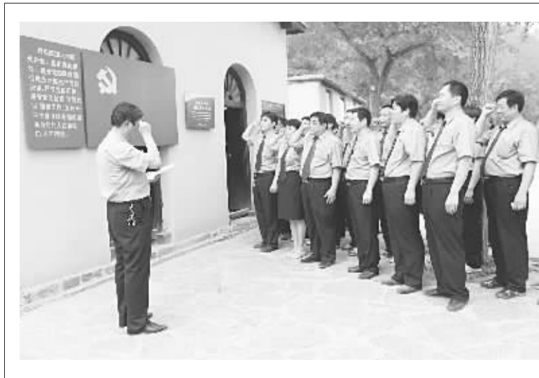
为加强检察队伍建设,强化对干警的革命传统和思想政治教育,日前,临城县检察院党总支组织全体干警到革命圣地西柏坡接受革命传统教育,感受老一辈无产阶级革命家的伟大思想、卓越智慧和丰功伟绩。图为临城县检察院干警在党的七届二中全会旧址前重温入党誓词的场面。

参与询问,但没有通知其法定代理人或者安排其他合适成年人到场参与询问。公安机关的侦查活动没有充分保障被害人的诉讼权利,违反了刑事诉讼法的有关规定。经向检察长汇报,遂对公安机关提出书面纠正违法意见,随后公安机关对此迅速进行了纠正。后经未检科审查认为两起案件事实清楚、证据确实充分,仅用半个月的时间就对上述案件提起公诉,有效打击了犯罪,保护了未成年被害人的合法权益。