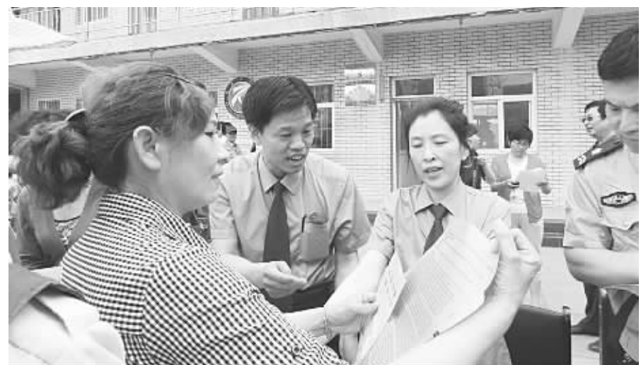
资讯图片:石家庄市桥西区检察院联合区法院、卫生等部门,组织各领域专业人才进社区开展服务群众活动。