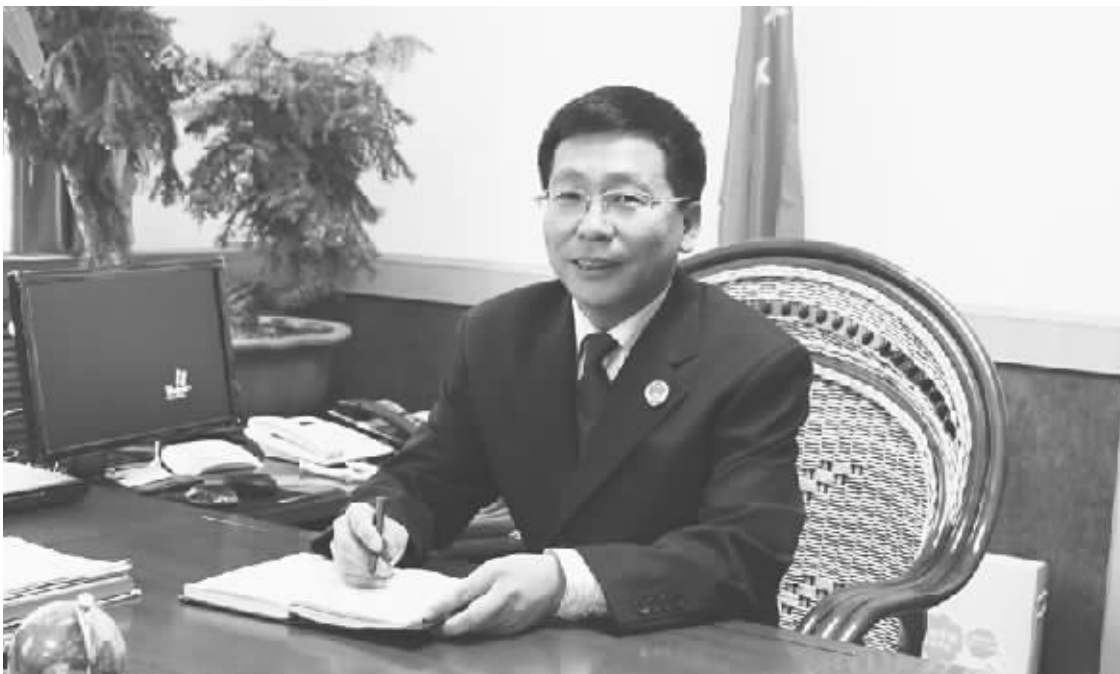
图为该院党组书记、检察长毕霄晋。

邯郸市邯山区人民检察院对党建工作常抓不懈,通过五项措施加强党的组织建设,增强党组织的凝聚力和战斗力,有力地推进了检察工作发展,并因此荣获省级文明单位。