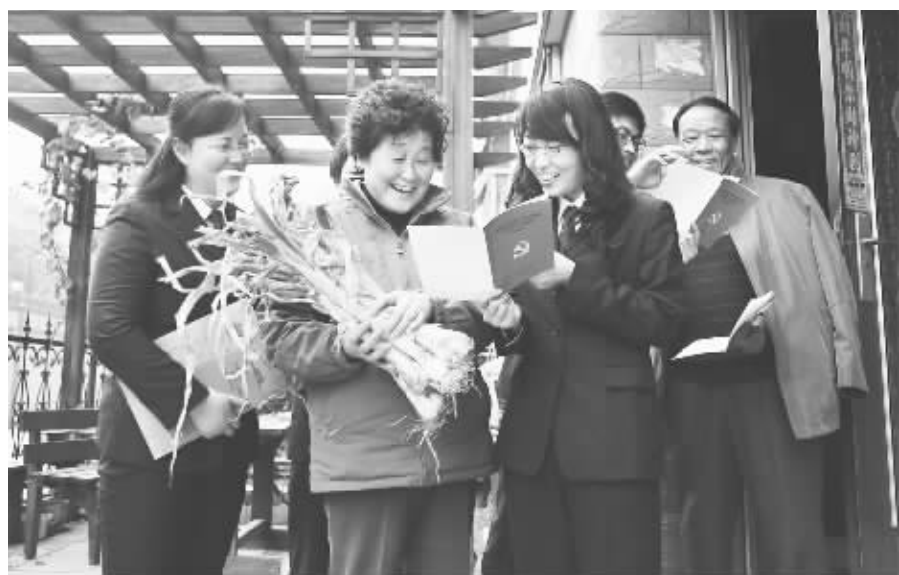
在认真学习宣传贯彻党的十八大精神的热潮中,石家庄市桥西区检察院组织30多名青年检察官成立“青年检察官宣讲团”,走进社区居委会,与基层党员一起座谈,就学习十八大报告的心得体会进行交流。宣讲团成员们还深入周边的居民区,向居民发放《学习贯彻党的十八大精神简明读本》,并对党的十八大要义、检察机关服务“两个环境”建设等进行了宣讲。图为宣讲团干警在与社区居民交流的场景。

法律教学实践基地的建立为实现检察机关与高校之间的沟通交流、资源共享、优势互补提供了有利的平台,有助于推进检察工作和法学教学实现共同发展进步。作为石家庄市桥东区检察院“创建学习型检察院”的重要举措之一,法律教学实践基地也为干警尽快适应修改后刑法,实现干警理论素养和文化素质的全面提升打下坚实基础。