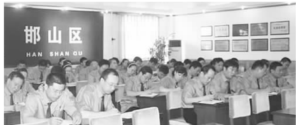
感悟“道德人生” 走进“道德讲堂”。

员的言谈举止并及时向领导汇报情况。庭审后,虽出现了围堵法院进而欲攻击公诉人的紧急情况,但由于防范措施得当,负责护送公诉人出庭的法警在法院工作人员的配合下,利用安全通道迅速带领公诉人员撤离法庭。避开了与被告人亲属的正面接触,保证了公诉人员的人身安全和庭审活动的顺利进行。