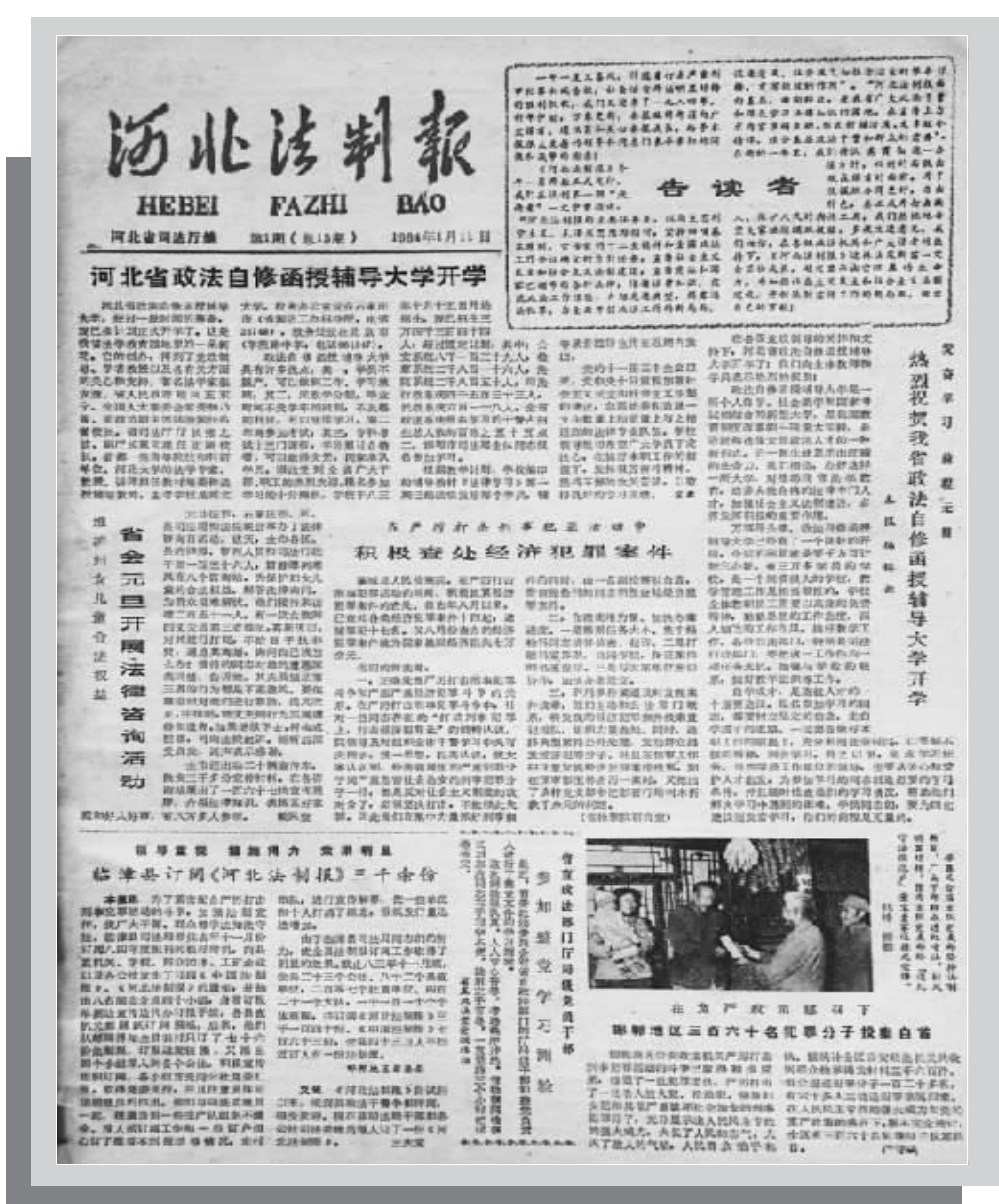
1984年1月11日本报公开发行的第一期报纸

●2001年1月1日,《河北政法报》恢复原名《河北法制报》,并出版日报。省领导王旭东、赵世居、张士儒、何少存等为报纸更名题词或寄语。 ●2001年4月,顾占奎、张华楷任河北法制报社总编辑。 ●2001年12月,报社副总编辑李文雁荣获河北省十佳新闻工作者称号。 ●2002年12月,省委政法委副秘书长李凤奇兼任河北法制报社社长、总编辑。 ●2002年12月,报社与省检察院合办的《法镜周刊》创刊。 ●2003年12月,报社划转到河北日报报业集团,由省政法委主管主办变更为河北日报报业集团主管主办,其他项目不变。