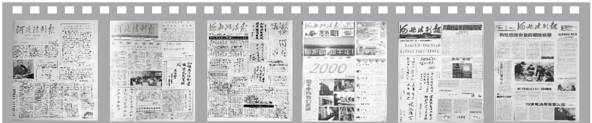
1984年6月9日《河北法制报》启用彭真同志题写的报头 1992年12月5日《河北法制报》创刊10周年 1994年1月1日两报合并后的《河北政法报》正式出版 2000年1月1日步入21世纪的第一期报纸 2001年1月1日恢复《河北法制报》报名 2012年11月1日改黑白印刷为彩色印刷